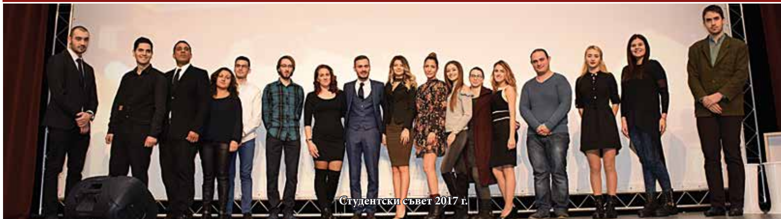
Студентски съвет 2017 г.