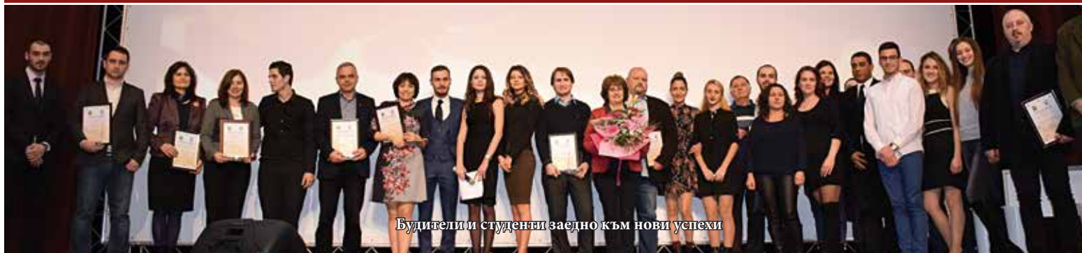
Будители и студенти заедно към нови успехи

На 30 ноември 2017 г. студентите и Студентският съвет от Русенския университет определиха за трета поредна годна Будители на Русенския университет 2017 г. В продължение на месец студентите имаха възможност да номинират хората, в които намират най-голямо вдъхновение, и при които усвояват най-пълноценно нужните знания за професионалното им развитие.